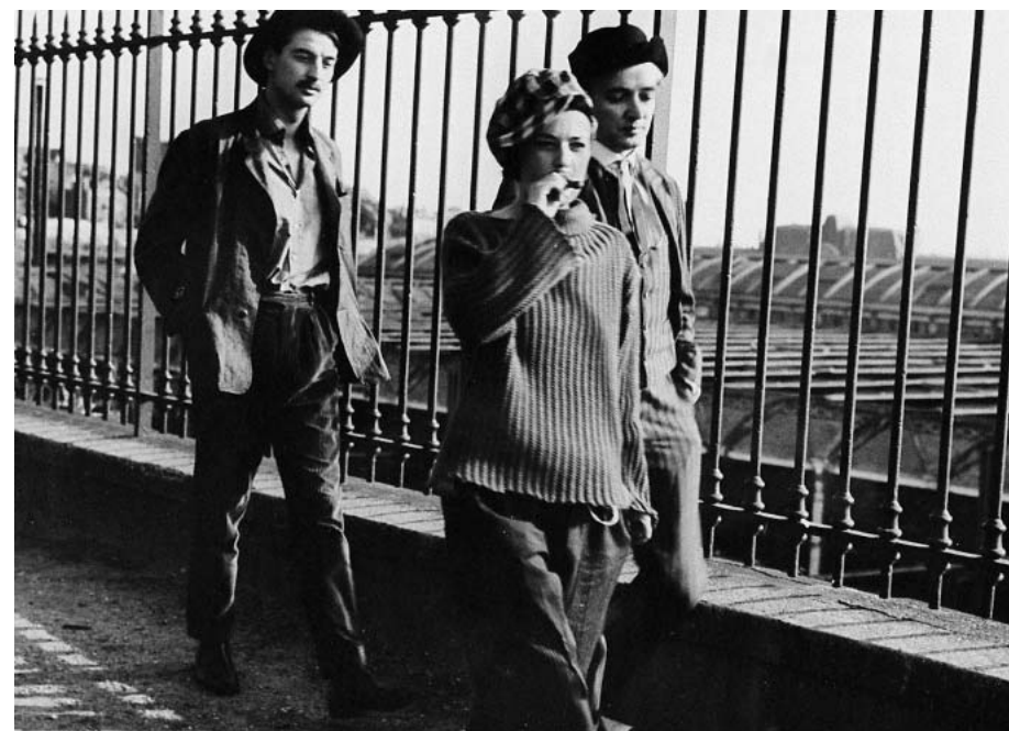
Truffauts Film „Jules et Jim“ setzte Hessels Liebesexperiment ein Denkmal.