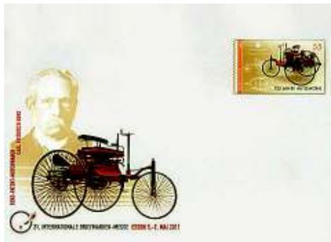
Optisch gelungen: Carl Benz und sein Motorwagen als Ganzsache

Ein Blick in Spezialkataloge zeigt das breite Spektrum dieser Ganzsachen, die anfängliche Vorbehalte, sie gestatteten einen offenen Blick aufs Geschriebene, bald vergessen machten. Zu besonderen Ereignissen wurden Sonderpostkarten aufgelegt, nicht immer mit Wertzeicheneindrucken, die sich an existierenden Briefmarkenbildern orientierten. So ließen sich die Wertzeichengestalter etwa zur Erinnerung an 25 Jahre Unterzeichnung des Grundgesetzes etwas Besonderes einfallen. Mit Dienstumschlägen und Karten der Deutschen Post AG kann der Ganzsachensammler aktuell seine Alben bestücken. Wer mehr Flair in die Kollektion bringen will, ist mit den Sonderpostkarten und -umschlägen gut bedient. Die jüngsten Erscheinungen sind der Bundesgartenschau in Koblenz, dem hundertsten Geburtstag der Viermastbark Passat und der Internationalen Briefmarkenmesse Essen gewidmet – letzteres Kuvert mit dem Motiv „Carl Benz und sein Motorwagen“ auf Wertzeichen und Bildzruck. Über solche Ganzsachen freuen sich nicht nur Sammler.