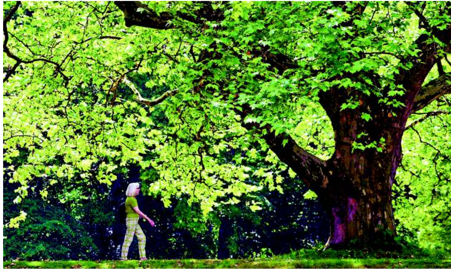
Wie alt die Platane wohl ist? Beim Spazierengehen kann man die Gedanken schweifen lassen.